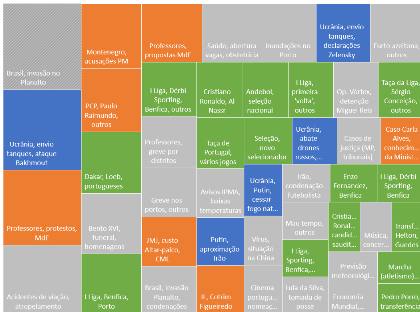
Os ‘clusters’ relacionados com política nacional estão identificados a laranja, os relacionados com Ucrânia, a azul e, a verde, clusters de desporto. Quadro construído com Índice de base = 100 em que a variável de interesse é o cluster com mais publicações (destacado com linhas oblíquas): “Brasil, invasão do Planalto”.

A invasão da Praça dos Três Poderes (TSF, 09/01/2023) foi o acontecimento que deu origem ao cluster com maior número de documentos publicados, de acordo com o algoritmo da plataforma Priberam. O evento foi ‘explosivo’, do ponto de vista do valor-notícia, quer pela sua dimensão, impacto ou imprevisibilidade, apesar de, posteriormente, neste caso, se ter noticiado a possibilidade da invasão poder ter estado a ser preparada há meses (TVI Notícias, 09/01/2023). Como em outros acontecimentos desta natureza, a cobertura foi intensa mas concentrada em poucos dias, tendo-se dissipado, rapidamente, do ciclo noticioso.