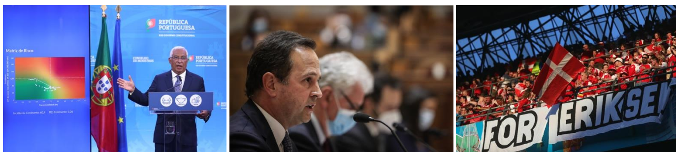
Da esquerda: António Costa em conferência de imprensa em Lisboa, 2/7/2021, Fernando Medina durante a sua audição na Comissão de Assuntos Constitucionais, 24/6/2021, dedicatória ao jogador dinamarquês Christian Eriksen antes do jogo entre Dinamarca e Bélgica, 17/7/2021.

A fase final do campeonato europeu de futebol não foi suficiente para fazer esquecer a pandemia. Nas páginas web dos órgãos de comunicação social não especializados, a pandemia voltou a ganhar relevância noticiosa à medida que os casos aumentaram, com particular incidência na capital portuguesa.