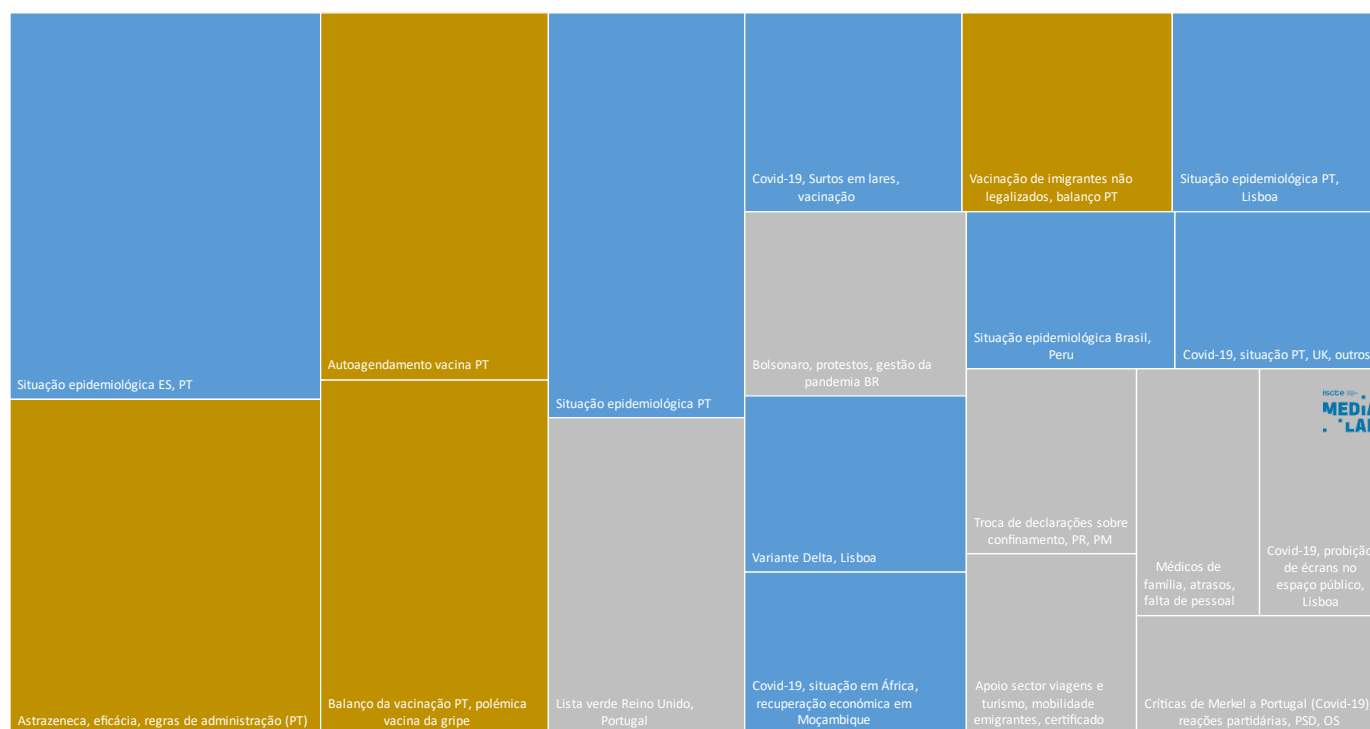
As notícias sobre Covid-19 com destaque para 2 grupos temáticos: evolução da pandemia em Portugal e no Mundo (cor azul), Vacinação (cor dourada). Outros temas estão identificados com a cor cinza.

De entre o conjunto de artigos relacionados com a pandemia, a variante Delta em Lisboa surge associada a um único cluster , com aproximadamente 200 artigos. Apesar do ressurgimento da pandemia estar relacionado com a propagação desta variante, em particular, na área metropolitana de Lisboa, os dados indicam que não foram muitas as peças dedicadas a este tema específico.